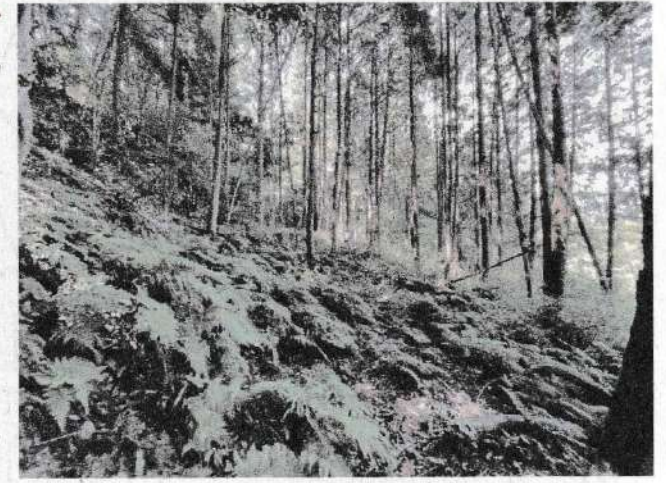
写真⑤ 地すべり地内