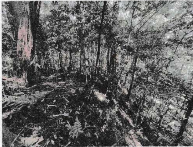
写真④ 地すべり冠頭部遷急線