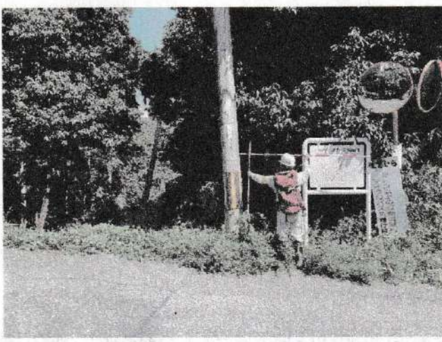
写真① 電柱傾倒状況