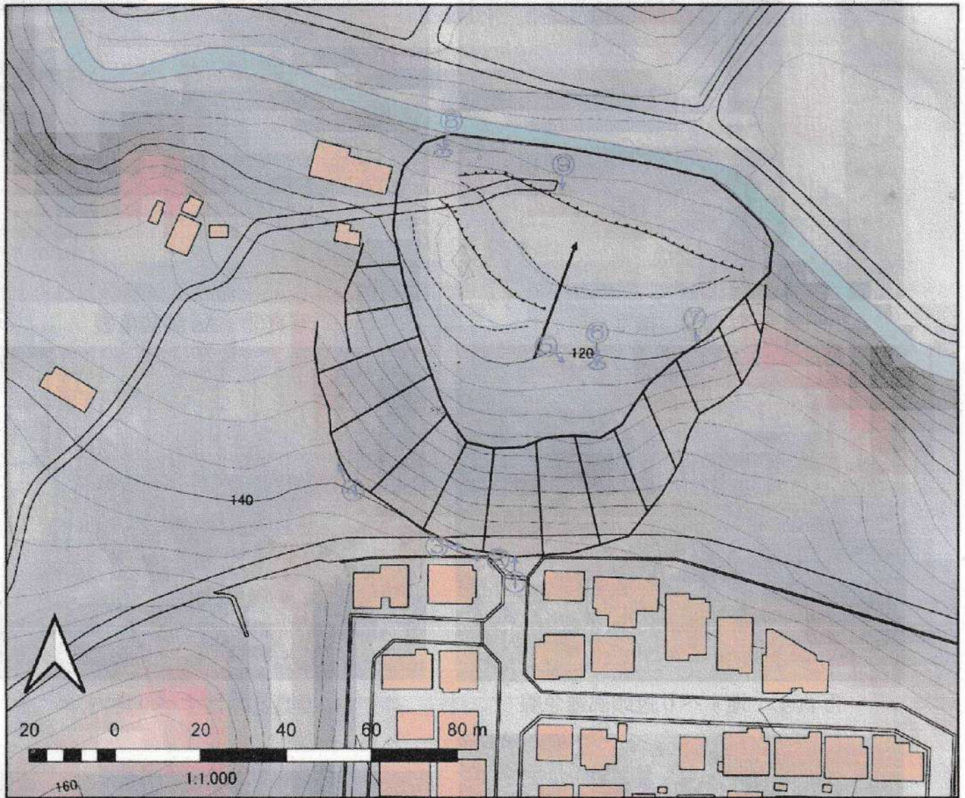
図 4.9 踏査結果平面図（日吉台）