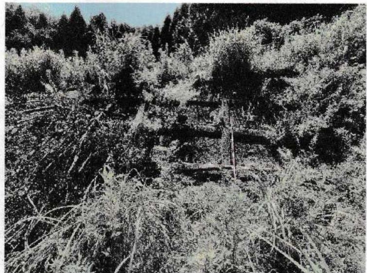
写真⑨ 地すべり末端部に施工されている 法枠工