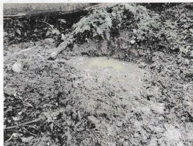
写真⑥ 地すべり地内湧水