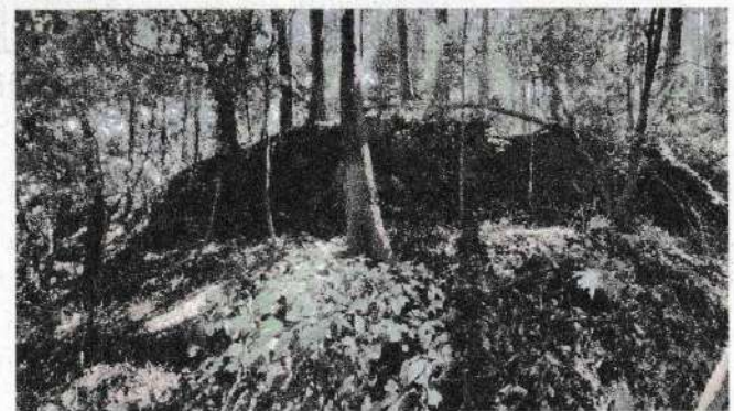
写真⑦ 右側壁亀裂状況