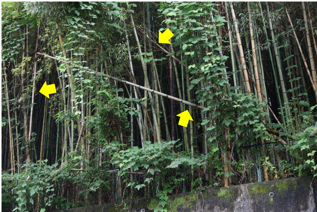
一部の竹は根元や途中で折れており、市道に落下する恐れがある。