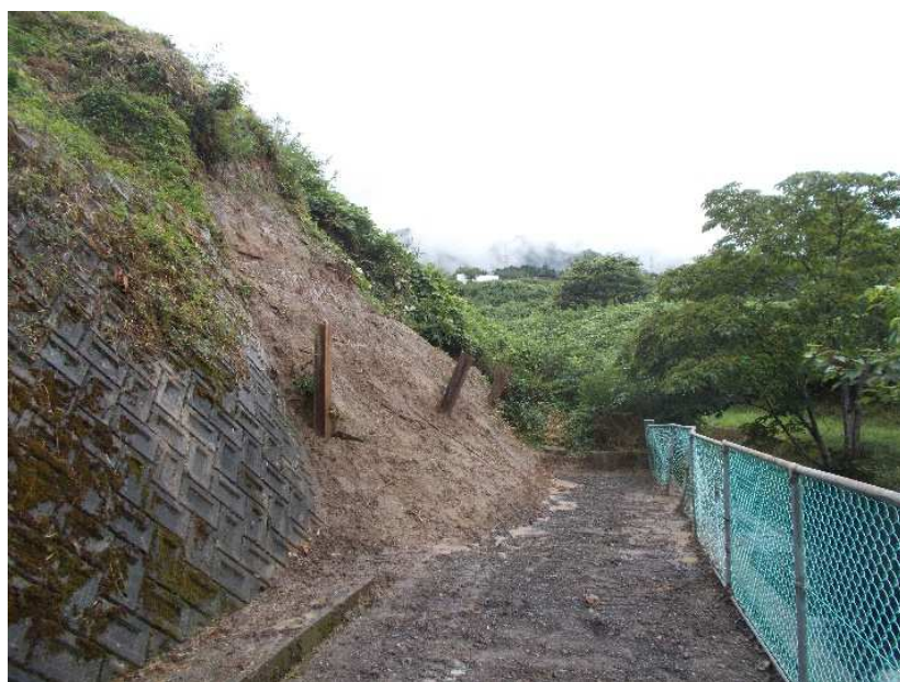
崩れた土砂を取り除いて重機で側面を押さえる整地 垂直のものと傾斜したH鋼は残っている