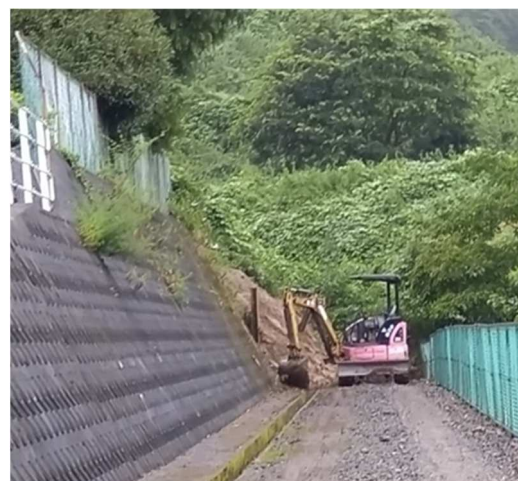
8月12日に重機がやっと入る