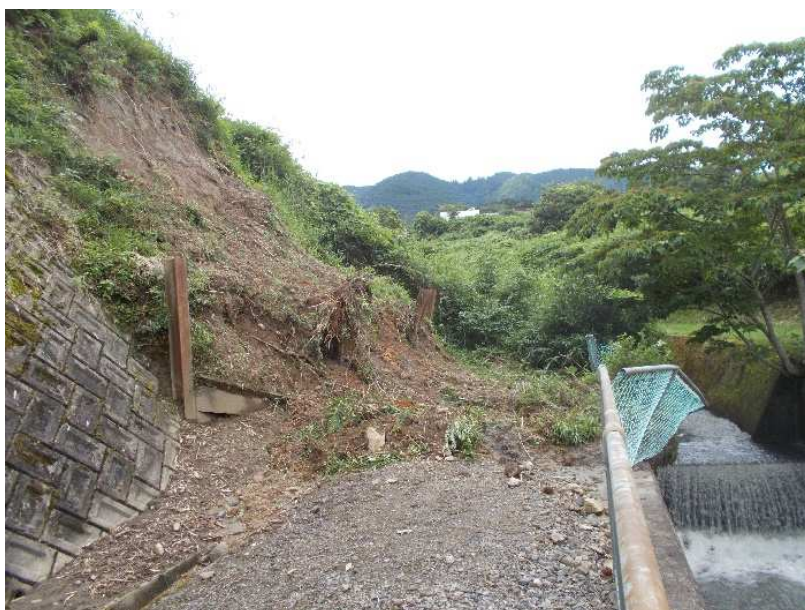
令和3年7月初めの豪雨で5号公園奥の崖崩れ現場