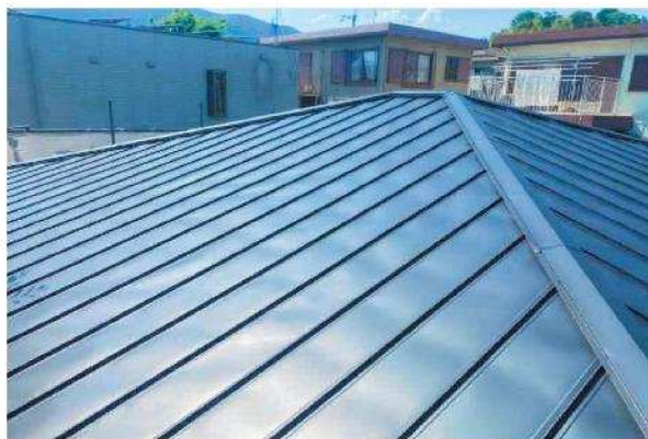
塗装工事前写真 玄関側