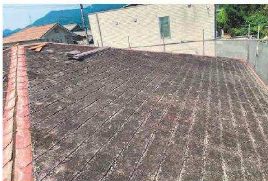
屋根工事前写真 庭側